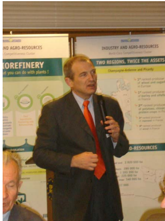
François Loos, ministre délégué à l'industrie, a présidé le dîner débat « la Stratégie de Lisbonne en action » en présence de nombreux députés Parlement européen, 13 février